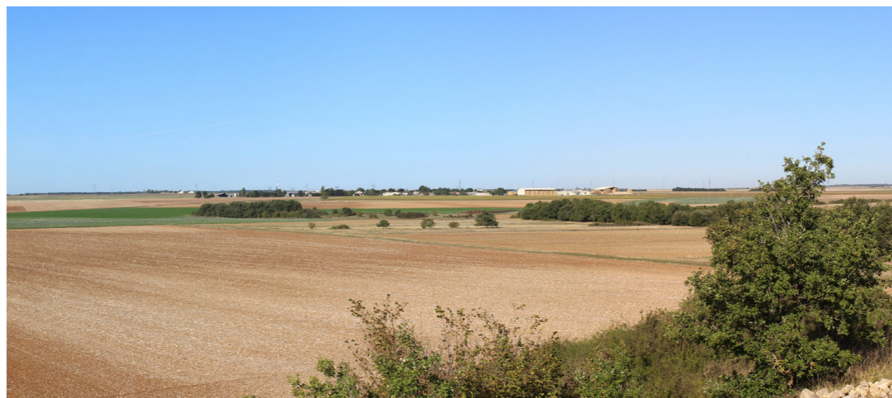
Photographie de l'état initial à 50°